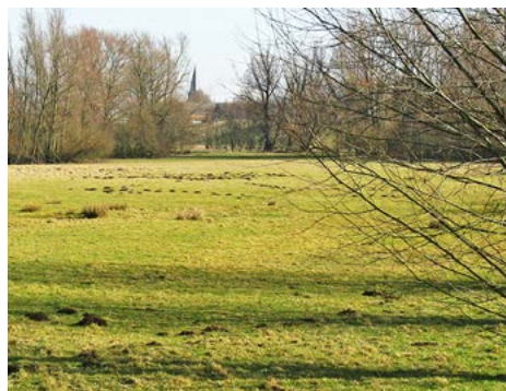
Afb. 2 De volgelopen kleiput (foto: G. Koppert, 1969) Afb. 3 De huidige locatie (foto: P.A. Seinen, 2017)